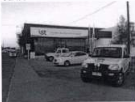
Centro de atención Curicó

En caso que suceda un accidente de origen laboral, el IST ha desarrollado un sistema de medicina curativa y de rehabilitación, acorde a los modernos esquemas de administración en atención de salud de los beneficiarios de la Ley.