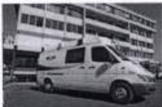
IST - Santiago Hospital Clínico