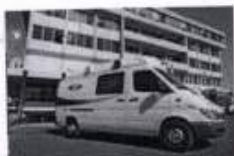
Hospital Clínico IST - Santiago