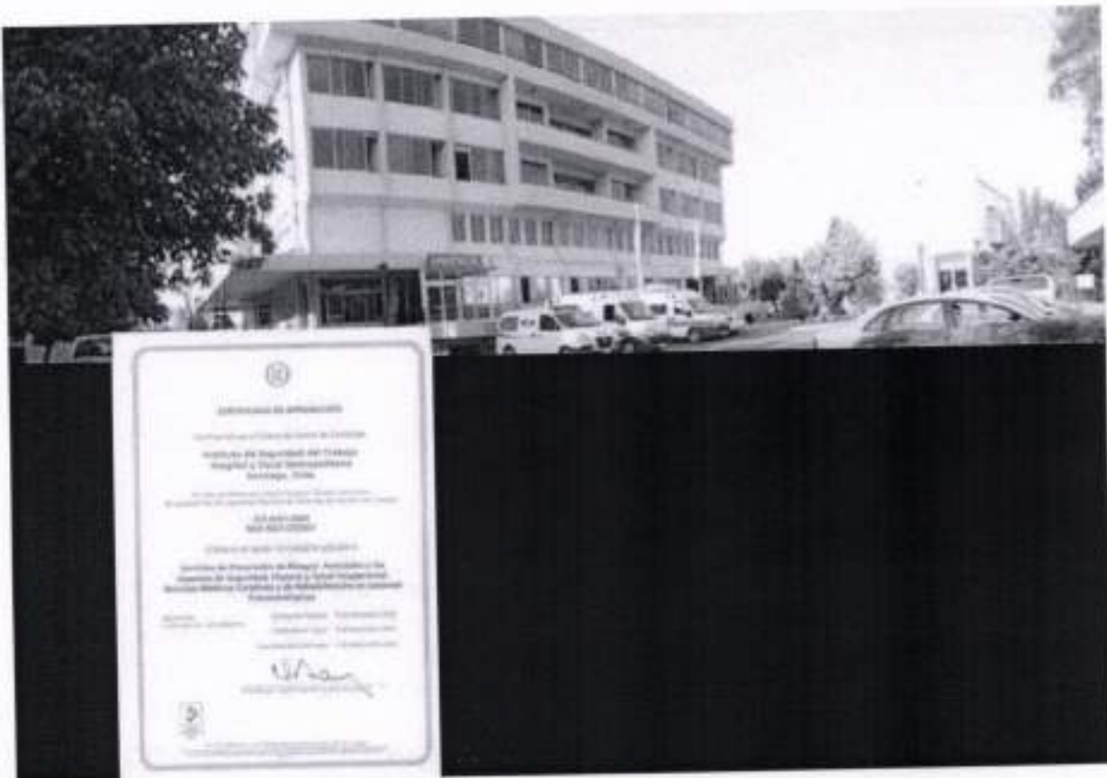
Transporte de accidentados. Urgencia.