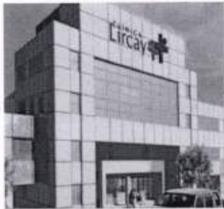
Centros de derivación ALTA RESOLUCION