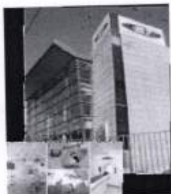
Hospital Clínico FACH - Viña del Mar